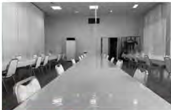
会食会場(飛沫防止パネルの設置)

また、会食を行いたいお客様にも安心して会食が行えるよう、長野県が進める「新型コロナ対策推進宣言」を実施し「信州版「新たな会食」のすゝめ」に沿った対応(テーブル配置の見直し、座席間隔の確保、飛沫防止パネルの設置など)を進め、安心して会食が行える環境も整えました。ご利用のご検討をお願い申し上げます。