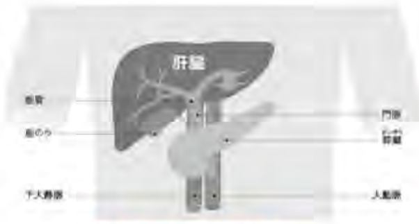
図1 肝臓と周辺の臓器の構造

「肝臓がんは腹部の右上にある肝臓に発生するがんです。肝臓は体内最大の臓器で、 ①栄養分を取り込んで体に必要な成分に変える ②体内の有害物質を解毒する機能があります(図1)。 肝臓には原発性肝がん(肝臓にある細胞ががん化する)、転移性肝がん