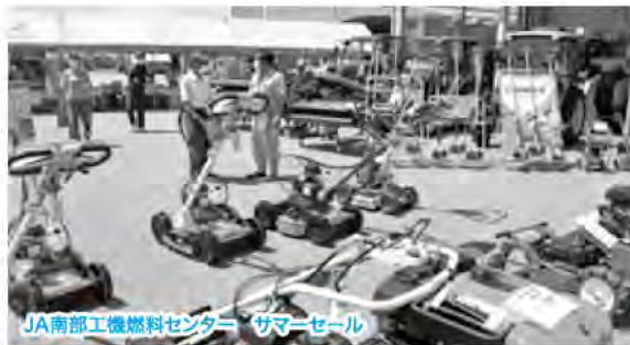
JA南部工機燃料センター サマーセール

7月5日、6日に大町市のJA平事業所で「たいら感謝祭」、7月8日、9日には同市のJA南部工機燃料センターで「サマーセール」が開催されました。たいら感謝祭ではお馴染みの食料品や衣料品などの販売が行われたほか、同センターのサマーセールではコンバインなど大型農機具の展示販売なども行われ、多くの方が会場に訪れていました。ご来場いただいた組合員、地域の皆さま、誠にありがとうございました。