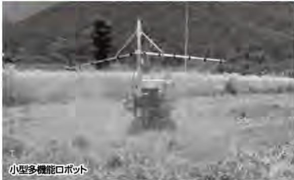
小型多機能ロボット