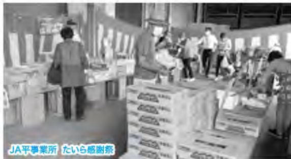
JA平事業所 たいら感謝祭

7月5日、6日に大町市のJA平事業所で「たいら感謝祭」、7月8日、9日には同市のJA南部工機燃料センターで「サマーセール」が開催されました。たいら感謝祭ではお馴染みの食料品や衣料品などの販売が行われたほか、同センターのサマーセールではコンバインなど大型農機具の展示販売なども行われ、多くの方が会場に訪れていました。ご来場いただいた組合員、地域の皆さま、誠にありがとうございました。