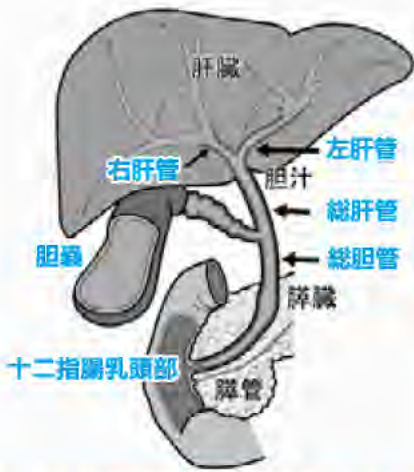
図1 日本消化器外科学会WEBサイト(2020年11月)

(図1)。胆管は、肝臓の中に張り巡らされた細い管(肝内胆管)として始まり、それらが合流しながら次第に太くなって、門部という肝臓からの出口で一本にまとまります(総肝管)。肝管は、胆嚢とつながる胆嚢管が合流して