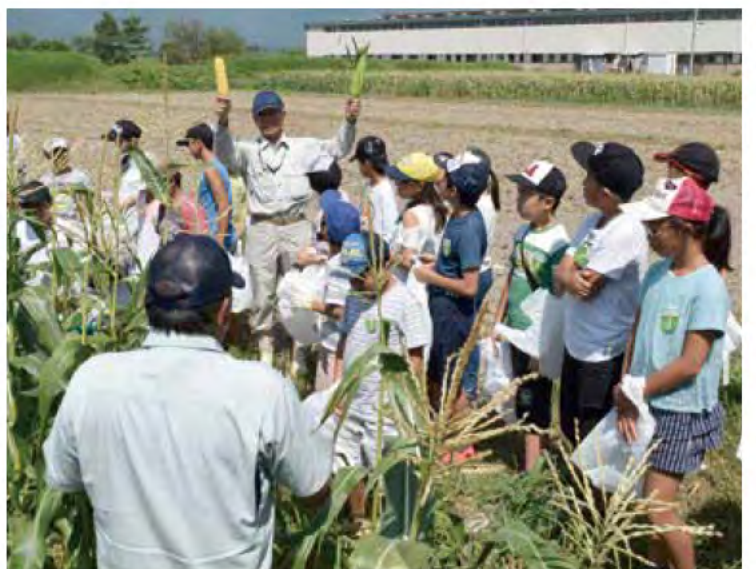
(中央) 早朝より作業を行う内鎌十日会の会員ら。 (左下) 収穫を迎えたトモロコシ(ゴールドラッシュ)。甘味が特徴。 (右下) トモロコシ収穫体験。会員の皆さんが子どもたちに収穫の仕方を丁寧に教えてくれる。(JA観光課と連携しての体験受け入れ／写真は平成30年8月)