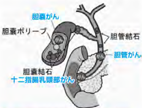
図2 日本消化器外科学会WEBサイト(2018年4月版)

胆道がんは、このいずれの部位にも発生しうる悪性腫瘍ですが、他の消化器がんと異なり、胆道の走行方向に沿って進展する(水平進展)特性があります。このためごく早期の場合を除いて切除範囲が大きくなることが多くなります(病変の広がりによ